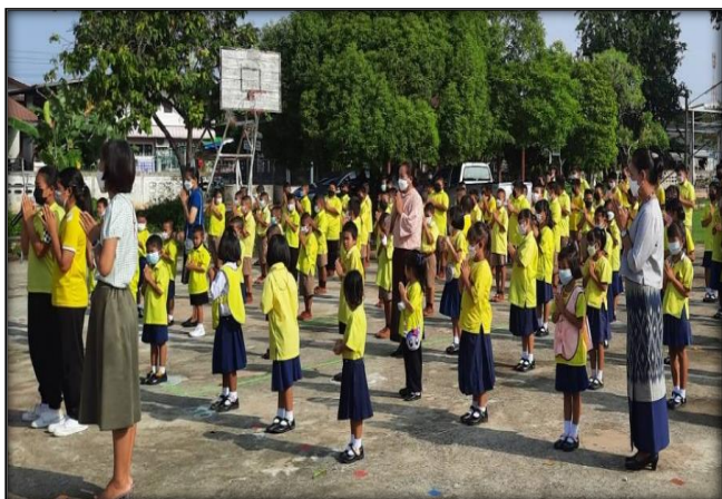
การสวดมนต์ไหว้พระ