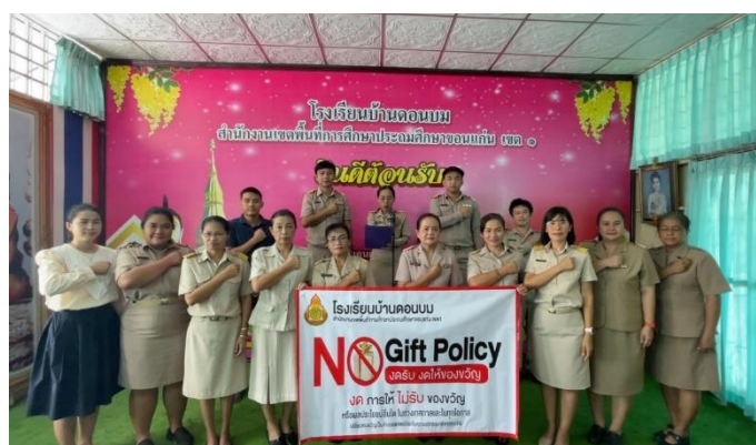
โรงเรียนบ้านดอนบมกล่าวคำปฏิญาณตน “โรงเรียนสุจริต