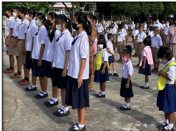
คณะครูยื่นเข้าแถว เคารพธงชาติ